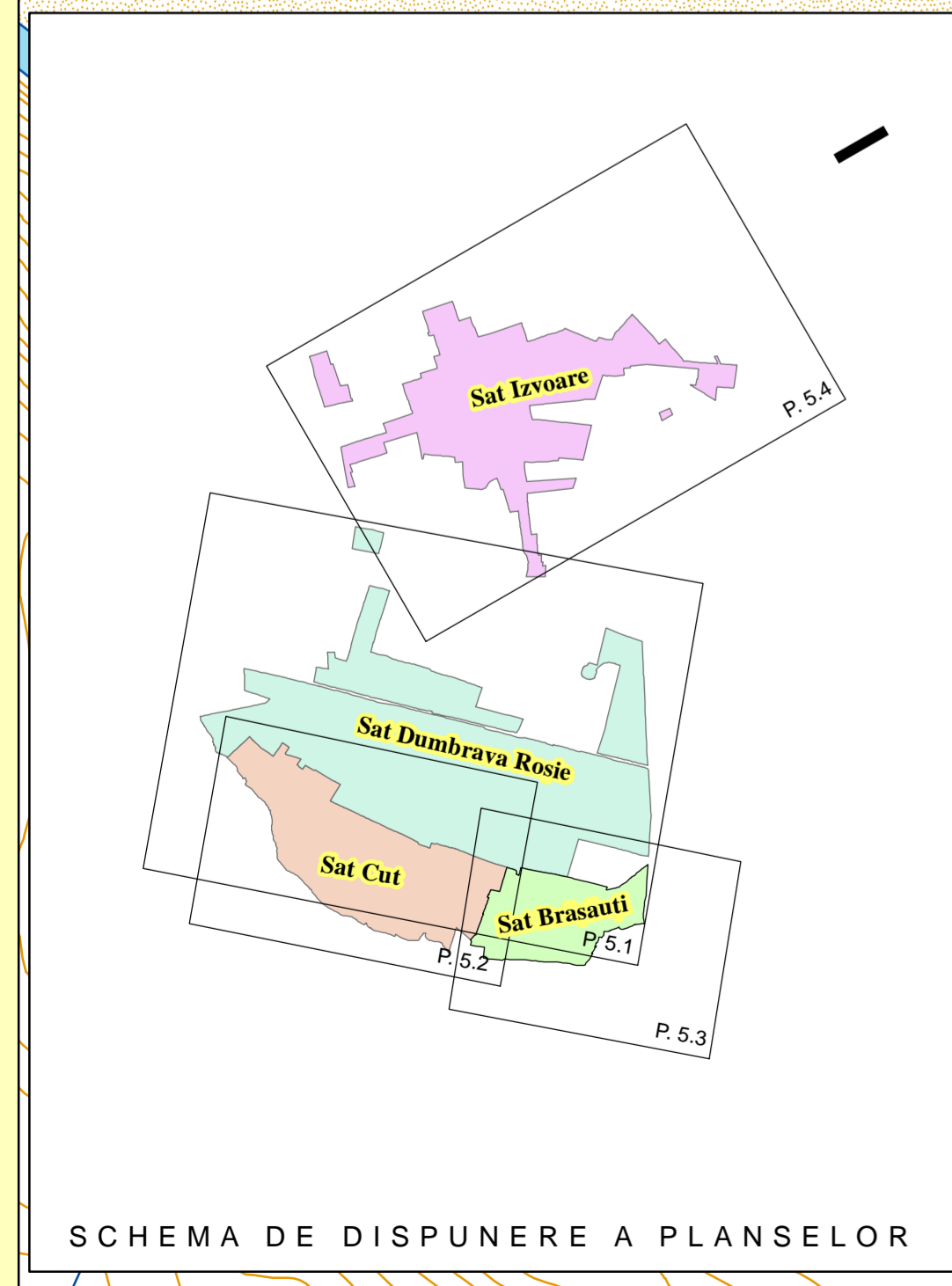
SCHEMA DE DISPUNERE A PLANSELOR